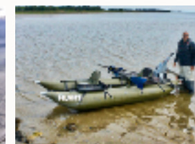
Klar til oplevelser i yderfjorden