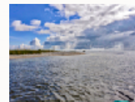
Hvor Gudenåen møder det salte Kattegat

En lydløs elektrisk Torqeedo motor sørger for fremdriften.