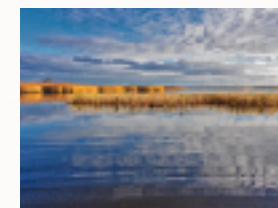
Rørskoven i Drønningborg Bredning.

En lydløs elektrisk Torqeedo motor sørger for fremdriften.