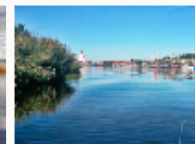
Det "Blinde Løb". Vandvejen til Randers Centrum