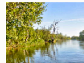
Gudenåen ved Stevnstrup.

Du indtager det behagelige forsæde og vi driver med strømmen mod Randers.