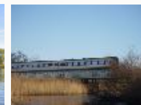
Det Randers producerede IC 3 tog passere Gudenåen.