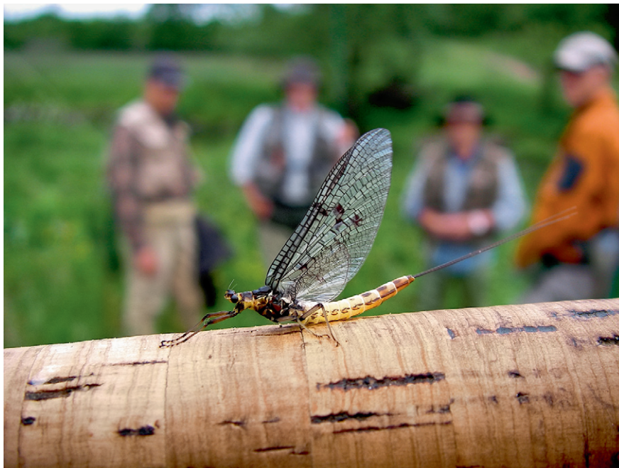
Talrige sværme af døgnfluer Ephemera danica (billedet) stiger og daler, snart med hvirvlende vingeslag, snart pludselig stående lodret i luften på stift udspændte vinger over fjordens rørskove. Parringen sker i luften, og æggene samler sig i en lille kugle, som efter en stund slippes og falder ned i vandet. De fleste døgnfluer lever kun få timer som voksne, men hvor de forekommer i mængder, møder man ofte den inkarnerede fluefisker.